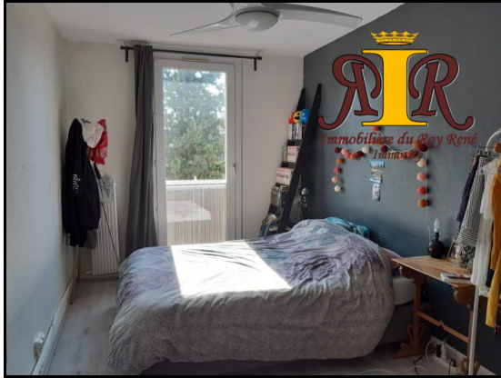
T3 HYPER CENTRE